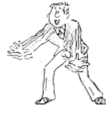
Yoshi (es geht weiter)