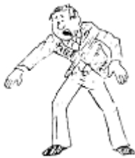
Osae-komi (Der Festhalter gilt)