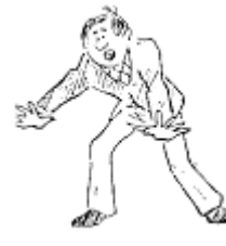
Sonomama (Nicht bewegen)